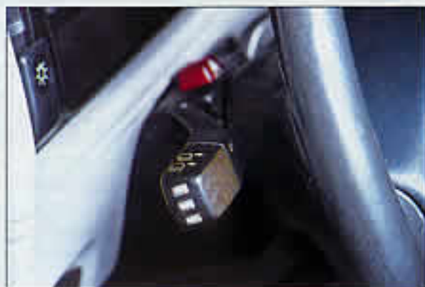
Das Bedienteil des Signalprozessors wurde in Maßarbeit ins Lenkrad eingepaßt. Damit läßt sich unter anderem die Lautstärke der Anlage einstellen, was Steven Sailer dazu veranlaßte, dem CD-Tuner im DIN-Schacht eine schwarze Abdeckung mit passendem CD-Schlitz zu verpassen.